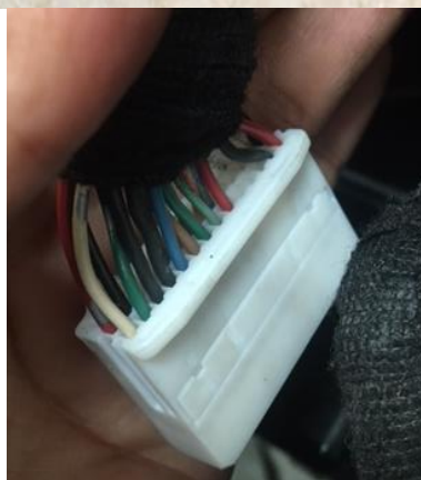
Conector 1 que se conecta en el autoestereo