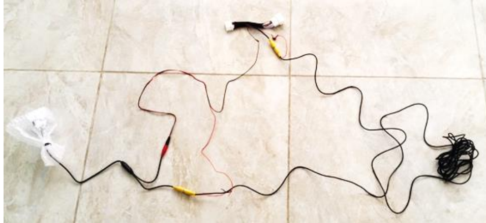
Cámara que se intenta instalar